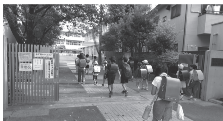
朝の校庭開放が始まり早朝から登校する子どもたち

援事業費の計上、校庭開放事業費の計上等を行うものです。歳入予算において、新型コロナウイルス感染症対応地方創生臨時交付金の増額等を行うものです。