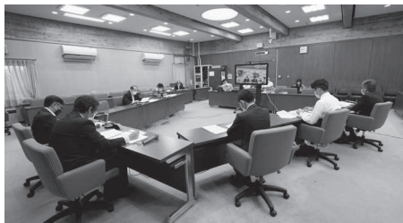
四日市市情報化実行計画の視察(四日市市) ※オンライン視察

本市では、情報化分野における個別計画として、平成24年に「三鷹市地域情報化プラン2022」を、令和2年には「みらいを創る三鷹デジタル社会ビジョン」をそれぞれ策定し、将来的には職員の減少も見込まれる中で、多様化・複雑化する地域課題に対応するため、デジタル技術を活用した変革(DX)を推進することとしています。そこで、その取組の参考とするため、先進事例である四日市市を視察しました。四日