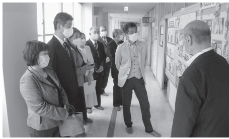
高尾山学園の視察(八王子市)

本市では、長期欠席傾向にある児童・生徒の支援に向けて、令和2年4月に適応支援教室A-Roomを開設し、教員免許を有する学習指導員による個別学習支援や心理専門職員による児童・生徒のカウンセリング等を実施しています。そこで、今後の不登校児童・生徒への支援の在り方の参考とするため、先進事例である八王子市を視察しました。八王子市では、不登校児童・生徒に合った教育課程を実現できる小・中一貫教育を推進する新しい学校