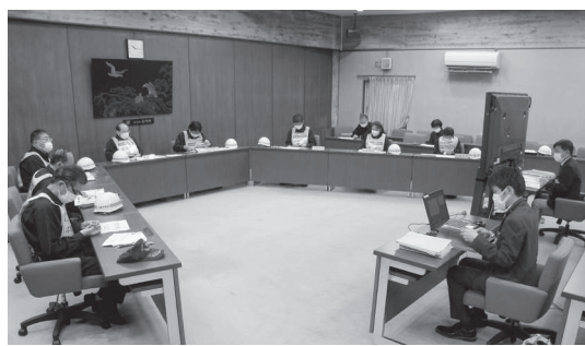
三鷹市議会防災訓練役員会(市議会協議会室)

れた首都直下地震等による東京の被害想定について説明を受け、地域の災害リスクへの理解を深めました。