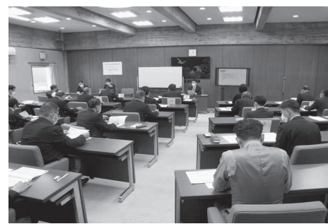
議員研修会市議会協議会室

三鷹市では、令和5年度に基本構想の改正、令和6年度に第5次基本計画の策定を予定しており、その策定過程に議会としてどのように関わっていくべきかを各議員が考える機会となり