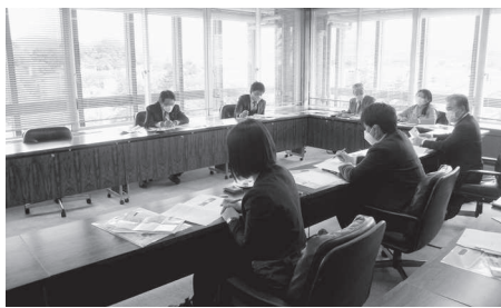
金沢ふらっとバスの視察(金沢市)

本市では、誰もが安全で安心して快適に移動できる公共交通環境の整備を目指しており、みたかバスネットの抜本的な見直しに向け、令和3年度に「三鷹市