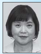
公明党 大倉あき子 議員

議員 2013年に改正された災害対策基本法では、共助による防災活動の観点から地区防災計画の制度が盛り込まれた。地域への計画の策定推進が災害対応力の向上につながる。計画について認識と現状を伺う。 副市長 地域防災活動の目標の一つに計画の策定を提案するなど、意識の醸成を図り共助の強化に努める。