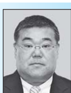
公明党 赤松 大一 議員

議員 低出生体重児の保護者が様々な相談ができる体制づくりが必要だ。本市における相談体制の現状と課題について伺う。 保健医療担当部長 新生児訪問等をきっかけに、継続的な相談支援につなげる対応を関係機関と連携し実施しているが、低出生体重児に特化した市の取り組みは限られているのが現状だ。