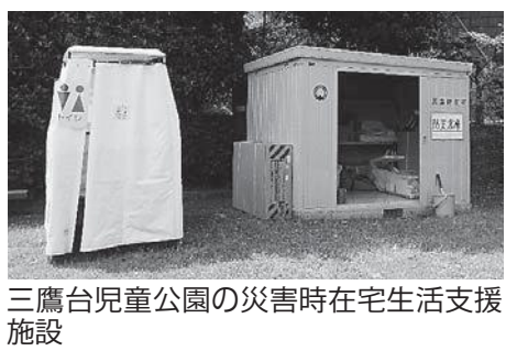
三鷹台児童公園の災害時在宅生活支援施設

議員 2013年に改正された災害対策基本法では、共助による防災活動の観点から地区防災計画の制度が盛り込まれた。地域への計画の策定推進が災害対応力の向上につながる。計画について認識と現状を伺う。 副市長 地域防災活動の目標の一つに計画の策定を提案するなど、意識の醸成を図り共助の強化に努める。