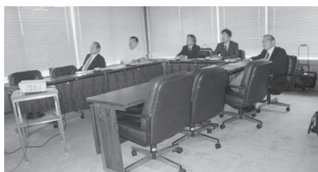
まちなか自転車利用環境向上計画についての視察(金沢市)

本市では、「三鷹市交通総協働計画2022」を平成28年3月に改定し、誰もが安全で安心して快適に移動できる交通体系の実現を目指して、自転車に関する事業として、自転車走行環境整備の検討、自転車安全教育の実施、サイクルシェア事業に向けた社会実験の実施と検証等を掲げています。そこで、その取り組みの参考とするため、先進事例である堺市と金沢市を視察しました。堺市では、堺