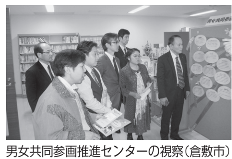
男女共同参画推進センターの視察(倉敷市)

に債権管理条例を制定しました。また、債権管理を総合的に所管する債権管理課の新設やコンビニ納付、クレジットカード納付の導入など、市の保有する債権の滞納額の圧縮に取り組んでいます。