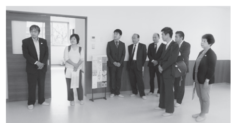
放課後児童健全育成事業と放課後子ども教室の連携についての視察(江南市)

江南市では、月に1回程度、小学1・2年生を対象に、共通プログラムとして学童保育所と放課後子ども教室それぞれに通う児童が合同で活動する日を設けています。プログラムの内容としては読み聞かせやレクリエーション等を実施しており、両者に通う児童の交流を図っています。