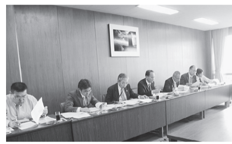
本人通知制度の取り組みの視察(明石市)

に向けて取り組んでおり、その参考とするため先進事例である明石市を視察しました。明石市では、証明書が発行された記録をシステム上で管理し、登録者に通知しています。更に、請求があった場合は、当該申請書を開示できるなど、不正取得による人権侵害の防止につながっています。