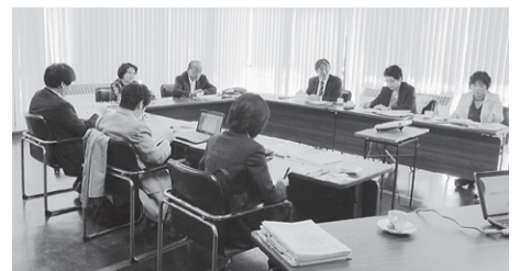
認知症初期集中支援チームの視察(坂出市)

本市では、認知症の高齢者等が住みなれた地域で、いつまでも安心して暮らせるまちづくりを進めるために、「認知症にやさしいまち三鷹」の推進に取り組んでいます。そこで、認知症の早期発見・早期診断の体制整備の参考とするため、先進事例である坂出市を視察しました。坂出市では、早期に認知症の鑑別診断が行われ、速やかに適切な医療・介護等が受けられる初期の対応体制が構築されるよう、「認知症初期集中支援チーム」を地域包括支援