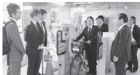
レンタサイクル新システムの視察(高松市)

進事例である北九州市を視察しました。北九州市は全国に先駆けて映画・ドラマの誘致と撮影支援を開始し、多くの有名作品の撮影支援実績を持っています。 ◇高松市(香川県) 高松市レンタサイクル新システム 本市では、サイクルシェア実験などで、杏林大学新