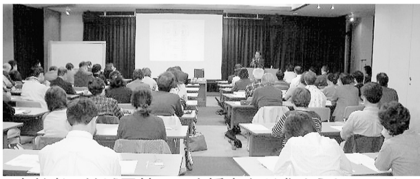
高齢者の地域貢献への支援充実が求められている...SOHOベンチャーカレッジの講座風景

議員 本市の保育園の待機児はいまだ多く、待機児への緊急対応が必要である。現在、待機児を抱え行政サービスを受けられないファミリー層が、他市で利用できるあり方を広域行政で連携強化したらどうか。 市長 保育園や認証保育所の相互利用は多くの市と連携している。今後も協力して保育ニーズにこたえたい。 議員 マンション等集合住宅に向けた政策誘導について