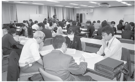
接遇研修でのグループ演習

同様にきちんと対応すべきと考える。「グッドリレーションみたか」等、研修に今後もしっかり取り組みたい。 議員 環境配慮都市「スマートタウン」の展開について所見を伺う。 市長 太陽光発電やリチウムイオン電池、電気自動車の導入等とともにICTを活用した環境配慮都市のイメージを、三鷹市の特徴を最大限に生かしながら、スマートタウンにどうつなげていくかが重要だ。