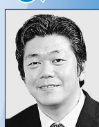
民主党 岩見 大二 議員

議員 増え続ける孤独死への対策には、孤独死の実態を把握することが必要だ。関係部署の情報共有化を図ったり、聞き取り調査等を実施し、実態把握に努めよ。 健康福祉部長 地域ケア推進事業等の孤独死を防止する取り組みを進めながら、実態調査を検討したい。 議員 孤独死対策として、水道やガスの利用状況で高