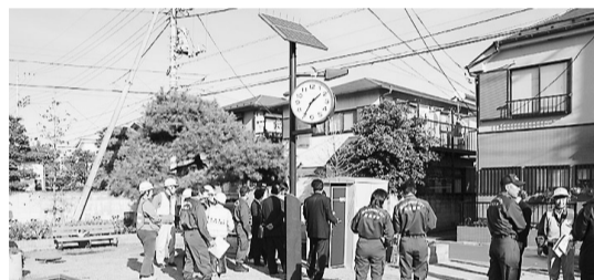
ソーラー電灯と防災用トイレを視察 …境南町防災広場（武蔵野市）