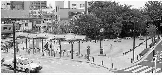
駅前活性化の観点からも「緑の小ひろば」の活用が望まれる

活用について所見を伺う。 市長 農地は防災上や都市環境の保全など、重大な役割を担うことを認識し、積極的な取り組みを深める。 議員 都市計画道路等の買収に伴い、大規模な農地の減少が予測される。代替地の確保に取り組みべきだ。 市長 東京むさし農業協同組合とも連携して、情報の収集に努めていきたい。 議員 これからの本市の農業は、消費者に近い都市型農業の立地メリットを生かし、さらなる地産地消を目指すべきである。消費者の集まる駅前などに農産物販売所を確保することが必要だと考える。所見を聞く。 市長 地産地消の考えにより、集客可能な新規直売所の開拓が必要と認識する。 議員 都市型の観光振興を推進する中で、農産物、食文化、生活文化を観光資源として活用できないか。 市長 農業に関連した様々な加工品や農業祭を活用して、観光振興につなげたい。 議員 「農のあるまちづくり」推進には、現行の生産緑地法、納税猶予制度等の課題を解決することが必要と考える。国、都への提案等、今後の取り組みを聞く。 市長 都市農業存続のため積極的な施策展開、検討をしていく。関係団体と連携し、国や都に働きかけたい。